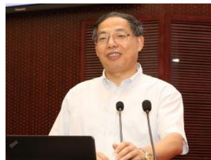
陈云敏 中国科学院院士