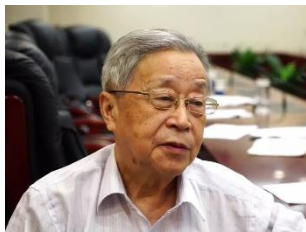
潘自强 中国工程院院士