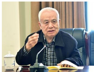
钱七虎 中国工程院院士